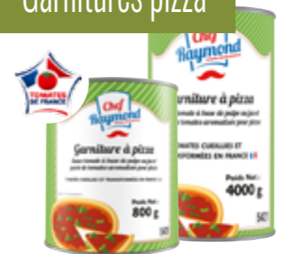
Réf. 5420/5421 Chef Raymond Garniture pizza Tomates cueillies et transformées en France Boite 4/4 x 12/Boite 5/1 x 3