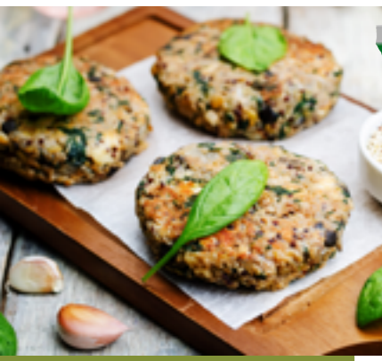
Graines de quinoa cultivées en Anjou, idéales pour des préparations chaudes ou froides : accompagnement, entrée, salade, dessert ...