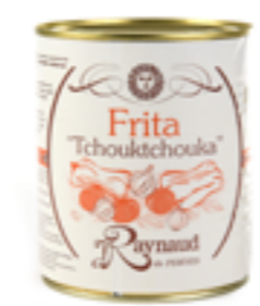
Réf. 8695 Frita RAYNAUD Garniture à base de tomates, poivrons et oignons Boite 4/4 x 6