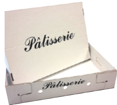
Réf. 5720/5721 Cagette pâtisserie micro cannelure 400 x 300 x 100 mm / 650 x 450 x 130 mm 50 unités 🇫🇷 ♻️