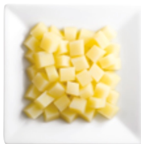
Réf. 541 Pommes de terre cubes LUNOR Cultivées, récoltées et transformées en France Sachet 2,5 kg x 4