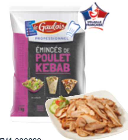
Réf. 300020 Émincés de cuisse de poulet kebab LE GAULOIS Sachet de 1 kg x 5 ❄️