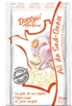
Réf. 602081 Ail du sud-ouest DAREGAL Sachet de 250 g x 10