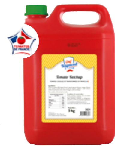
Réf. 5424 Chef Raymond Tomato Ketchup Tomates cueillies et transformées en France Bidon de 5 L