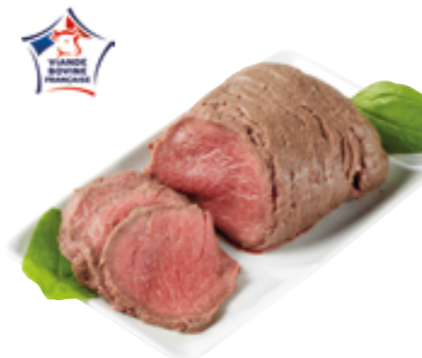
Réf. 670230 Rôti de bœuf tranché Roti de 400 g x 10 ❄️