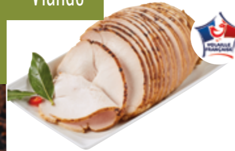
Réf. 670349 Roti de dinde tranché Roti de 500g x 8 unités ✨ ❄️