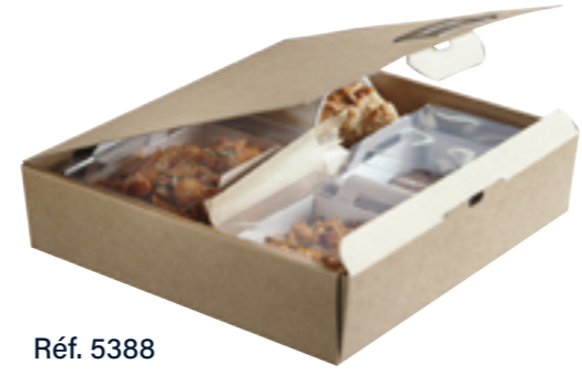
Réf. 5388 Coffret repas Vision + Kraft brun 300 x 292 x 72 mm Paquet de 50 🇫🇷 ♻️