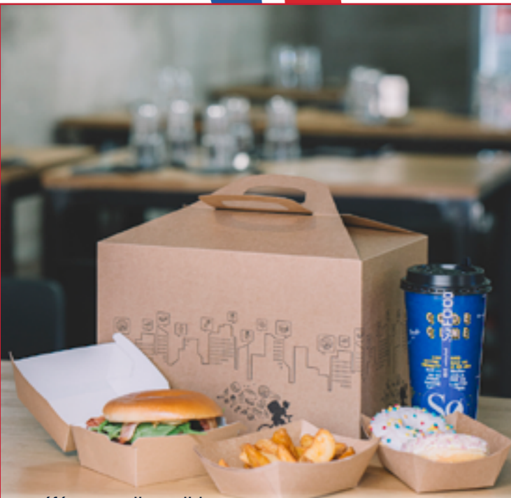
6 références disponibles Gamme emballages SNACKING "DELIVERY" Kraft brun