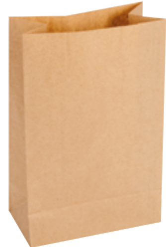
Réf. 5844 Sac vente à emporter Kraft brun 60 g - 230 + 110 x 400 mm Paquet de 250 🇫🇷 ♻️

Demandez le détail des tailles, références et spécificités de tous les emballages fabrication française à votre distributeur DISGROUP !