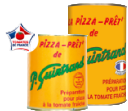
Réf. 108/109 Garniture Pizza Pret' GUINTRAND Elaborée avec de la tomate de Provence Boite 4/4 x 12/Boite de 5/1 x 6