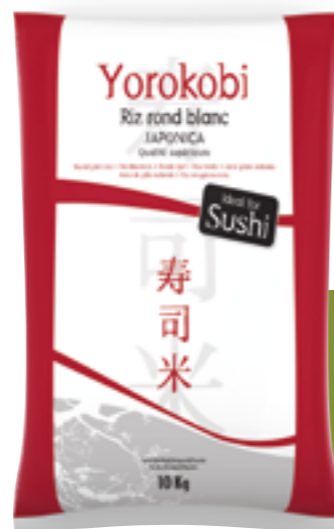
Réf. 6419 Riz rond pour sushis YOROKOBI Sac de 10 kg

Riz de qualité supérieure, respectant les exigences de la cuisine asiatique. Sélection variétale opérée en terres camarguaises !