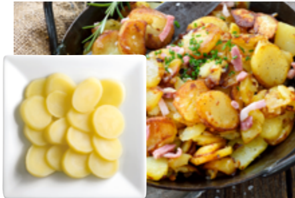
Réf. 644 Pommes de terre en lamelles LUNOR Cultivées, récoltées et transformées en France Sachet 2.5 kg x 4