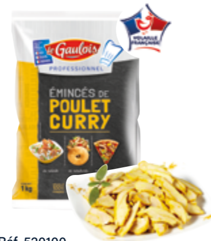
Réf. 520100 Émincés de cuisse de poulet curry LE GAULOIS Sachet de 1 kg x 5 ❄️