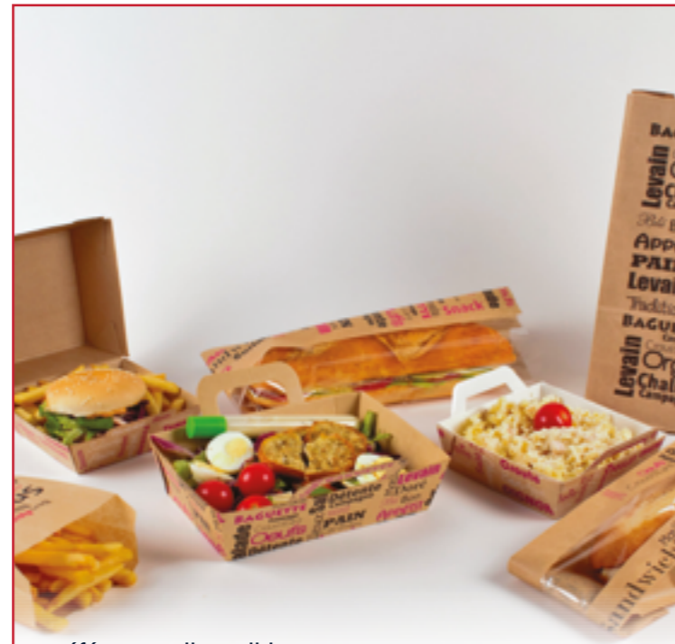
6 références disponibles Gamme emballages SNACKING "LE SUCCÈS" DISGROUP