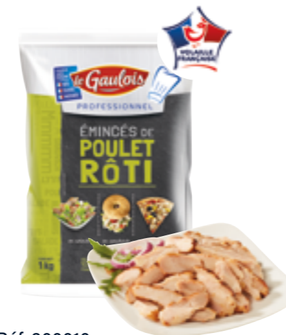
Réf. 300010 Émincés de cuisse de poulet cuit rôti LE GAULOIS Sachet de 1 kg x 5 ❄️