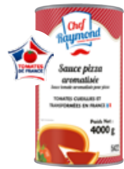
Réf. 5422 Sauce Pizza aromatisée Tomates cueillies et transformées en France Boite 5/1 x 3