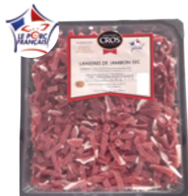
Réf. 8079 Lanières de jambon sec SALAISONS CROS Barquette de 500 g x 5