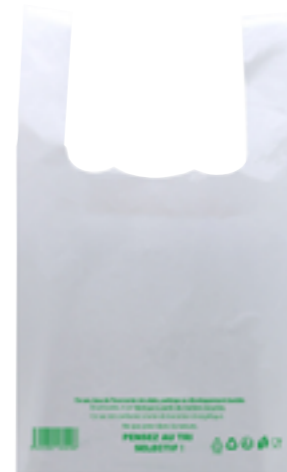
Réf. 8446 Sac bretelles gaine blanche 50μ - 260 + 60/60 x 450 mm Colis de 500 🇫🇷 ♻️