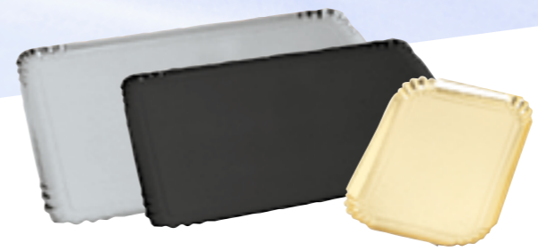
8 références disponibles Gamme plateaux traiteur 1200 g / m 2 Argent - Noir - Or / 3 tailles