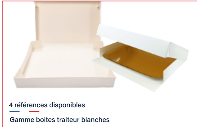
4 références disponibles Gamme boîtes traiteur blanches