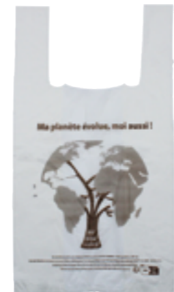
Réf. 2594 Sac bretelles "home compost" 13μ - 260 + 60/60 x 450 mm Paquet de 10 x 100 unités 🇫🇷 ♻️