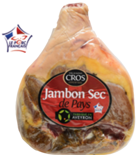
Réf. 1044 Jambon sec de pays SALAISONS CROS Sans os Pièce de 5,3 kg x 2 ✨