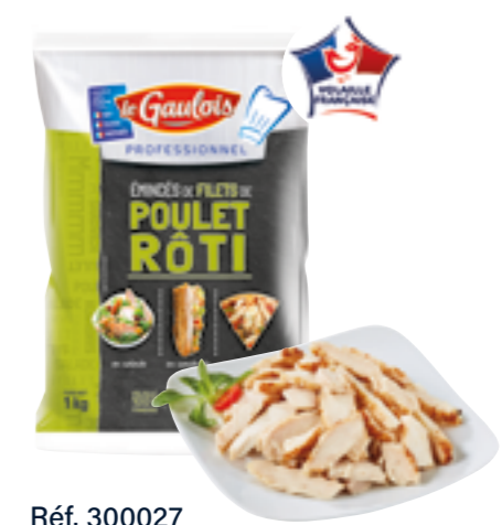
Réf. 300027 Émincés de filet de poulet rôti LE GAULOIS Sachet de 1 kg x 5 ❄️