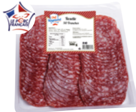
Réf. 8143 Chef Raymond Rosette de Lyon tranchée 50 tranches Barquette de 500 g x 6