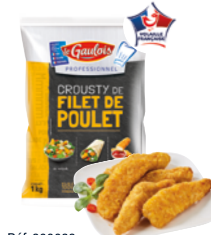
Réf. 300039 Crousty de filet de poulet cornflakes LE GAULOIS Sachet de 1 kg x 5 ❄️