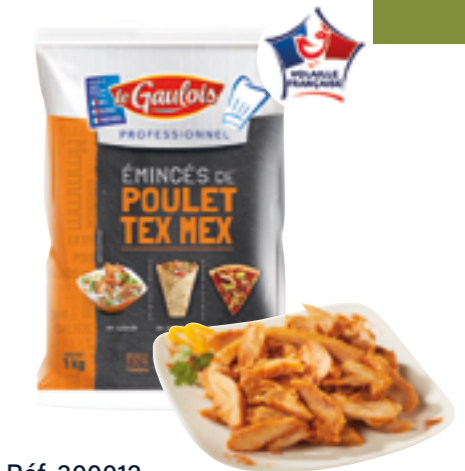
Réf. 300012 Émincés de cuisse de poulet Tex Mex LE GAULOIS Sachet de 1 kg x 5 ❄️