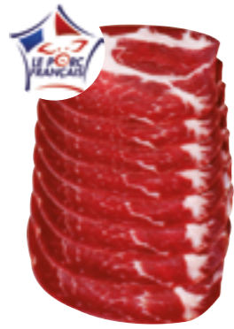
Réf. 7698 Coppa tranchée SALAISONS CROS 50 tranches de 10 g Barquette de 500 g x 6