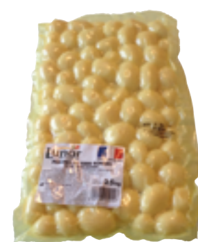
Réf. 1043 Pommes de terre rondes LUNOR Cultivées, récoltées et transformées en France Sachet 2,5 kg x 4