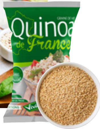
Réf. 2218 Quinoa blond de France VIVIEN PAILLE Sac de 2,5 kg