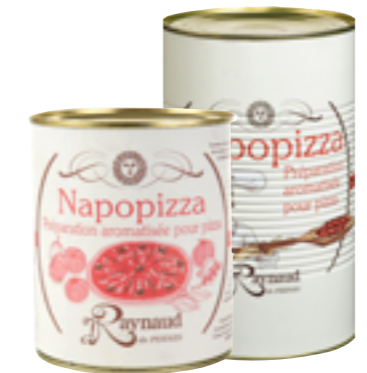
Réf. 8694/8693 Napopizza RAYNAUD Sauce tomate aromatisée Boite 4/4 x 6/Boite 5/1 x 3