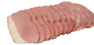
Réf. 671004 Filets de canard cuit fumé JEAN FLOCH 10 plaques ❄️