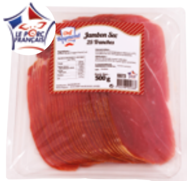
Réf. 6973 Chef Raymond Jambon sec tranché 25 tranches de 20 g Barquette de 500 g x 6