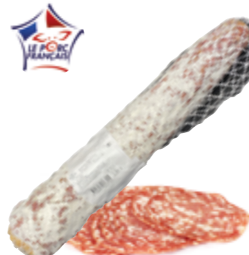
Réf. 5089 Rosette supérieure SALAISONS CROS Pièce d'environ 3 kg x 4 ✨